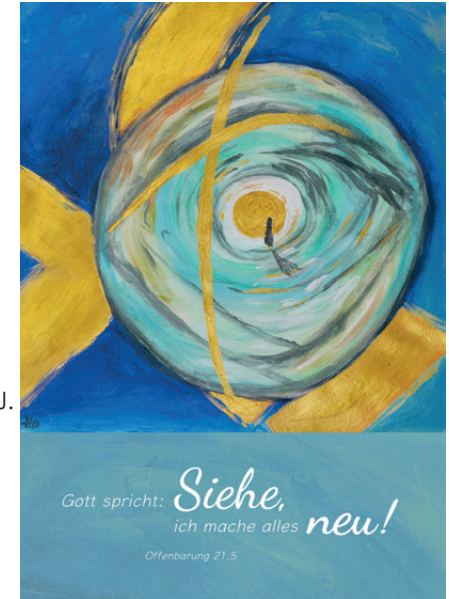
Acrylmalerei von Doris Hopf

Besondere Geburtstage von Gemeindegliedern, die älter als 74 Jahre sind, sowie Ehejubiläen und Amtshandlungen (Taufen, kirchliche Trauungen und kirchliche Bestattungen) werden im Gemeindebrief der Kirchengemeinde veröffentlicht. Kirchenmitglieder, die dieses nicht wünschen, können das der Kirchengemeinde schriftlich mitteilen. Die Mitteilung muss bis spätestens 31. April 2026 der Kirchengemeinde vorliegen. Vielen Dank für Ihr Verständnis.